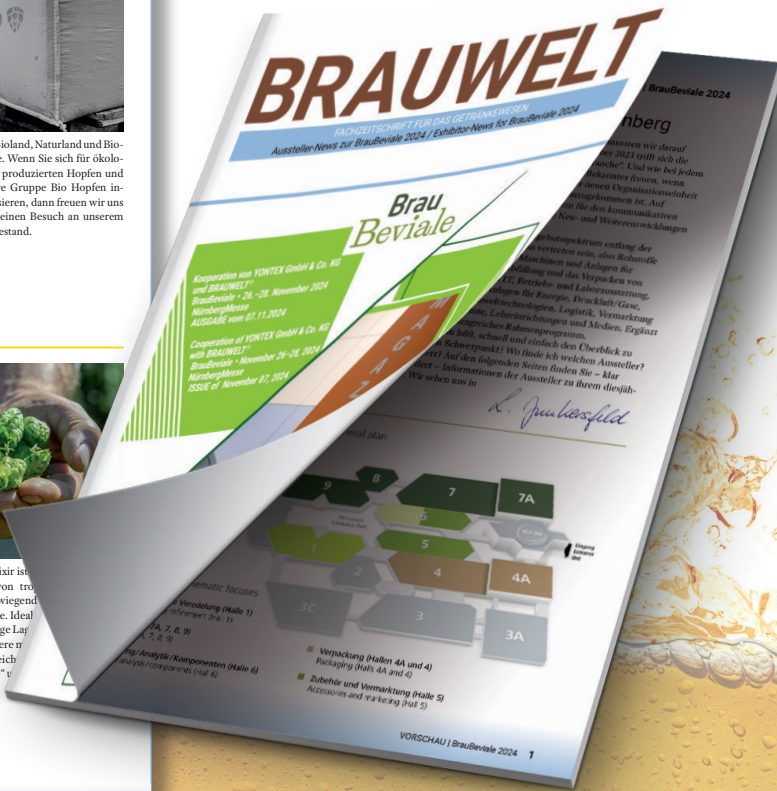
VORSCHAU | BrauBeviale 2024